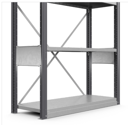
Sokkeli Korkeus: 40 mm Leveys: 1000 mm, 1300 mm