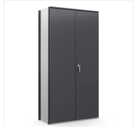
Oviosa Korkeus: 2000 mm Leveys: 1000 mm