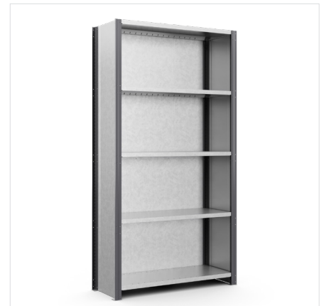
Takalevy Korkeus: 2000 mm, 2500 mm, 3000 mm Leveys: 1000 mm, 1300 mm