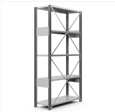
Hyllytasojen leveydet: 750 mm, 1000 mm ja 1300 mm