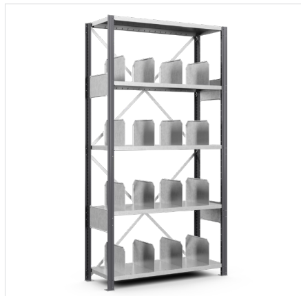
Väljakaja Syvyys: 200*300–600 mm