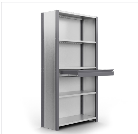
Vetolaatikko Syvyys: 400 mm, 500 mm Leveys: 915 mm