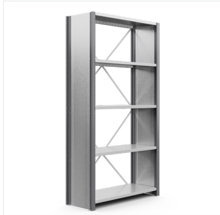
Runko, suljettu Korkeus: 2000 mm, 2500 mm, 3000 mm Syvyys: 300–600 mm