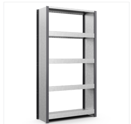
Etu-/takareunalista Leveys: 1000 mm, 1300 mm