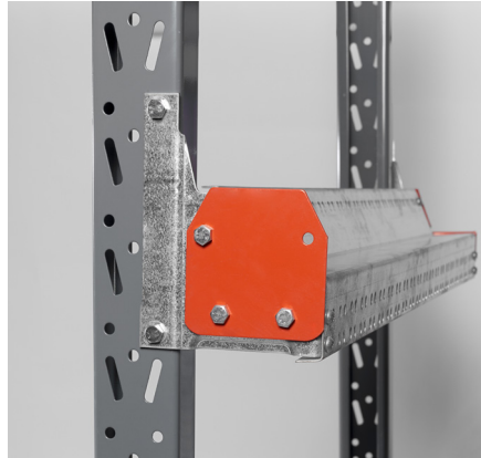
Lavarajoitin estää lavaa työntymästä liian pitkälle.